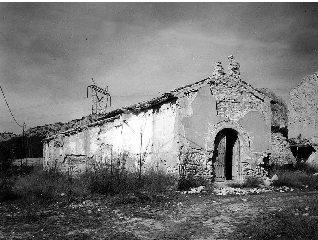
Ermita de San Antonio de Padua en La Fuesecca.

Trascripción efectuada por Manolo Hernández. Abril de 2.005